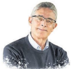
Economista de la Universidad de Medellín, con especialización en Política Económica de la Universidad de Antioquia. Máster en Estudios Políticos e Internacionales de la Universidad del Rosario.

Esto significa que los jóvenes, desde su derecho inalienable a la educación, deben tener la capacidad de decidir qué y dónde estudiar, teniendo a su disposición un Estado que regule y facilite el acceso; pero, al mismo tiempo, reconozca a los agentes privados como socios estratégicos en el fortalecimiento de la cobertura, la pertinencia y la calidad.