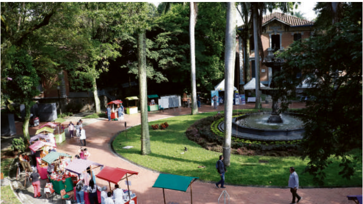
Esta feria también se convierte en la oportunidad de conocer los talentos artísticos de los pacientes y sus familias.