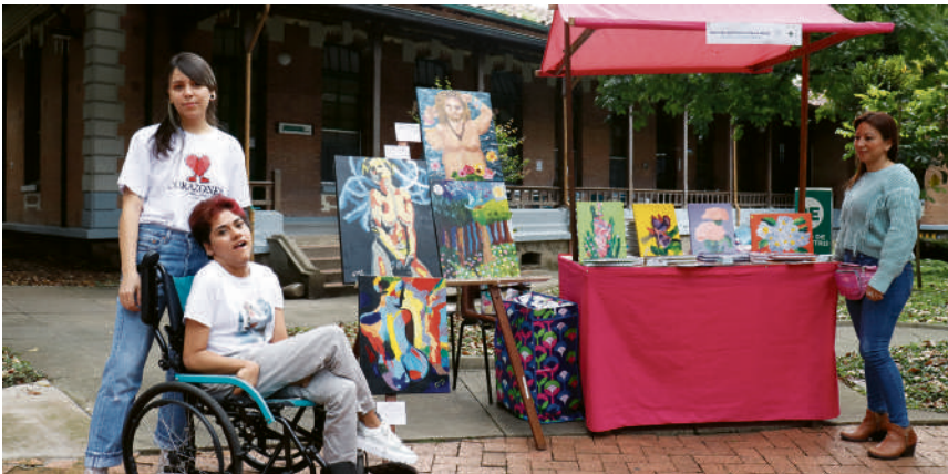
Las personas interesadas en conocer más sobre esta iniciativa pueden escribir al correo electrónico: eventos@sanvicentefundacion.com