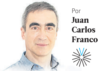
Por Juan Carlos Franco

Esta columna, a lo largo de casi dos décadas, ha analizado para Vivir en El Poblado muchos de los proyectos importantes para la ciudad y para el departamento en general. Frecuentemente ha asumido posiciones claras y críticas, a veces ácidas, irónicas, frente a aquellos proyectos que, a juicio del autor, terminarían produciendo resultados muy diferentes a los prometidos. Sin embargo, algunas veces la realidad no ha resultado tan negativa como la columna se atrevía a pronosticar. O incluso, los resultados en la práctica han sido brillantes, en contraste con el supuesto descalabro que se vaticinaba. Quizá el fracaso predictivo más notable sea el Túnel de Oriente. Aunque aquí decíamos que tendría baja utilización, pero su éxito es arrollador, indiscutible. Fue acogido y utilizado por parte de los usuarios más allá, incluso, de las proyecciones más optimistas. A pesar de no tener doble calzada, a pesar de no permitir sobrepasos. Hoy frecuentemente opera a máxima capacidad. Es probable que el hecho tan simple de circular todos a una velocidad constante y –excepcional en nuestro medio– no permitir el paso de motos, baje sustancialmente el estrés haciendo del cruce del túnel un breve pero bienvenido tiempo de tranquilidad relativa para los conductores. Felicitaciones.