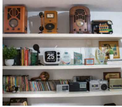
Este concierto es un tributo a la historia de música tropical y por eso, aquí también están presentes sus objetos.