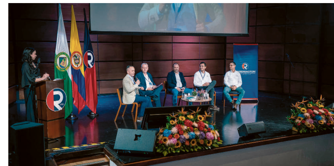
Rectores de cuatro universidades de Medellín (Uniremington, ITM, Pascual Bravo y TdeA) se reunieron con expertos del continente para analizar el papel de la educación superior como vehículo para impulsar la competitividad en Antioquia. Aunque hay avances, también son muchos los retos y tareas pendientes.

En Colombia, la expansión y cobertura de la educación superior en las regiones más apartadas y vulnerables del territorio nacional siguen siendo asignaturas pendientes.