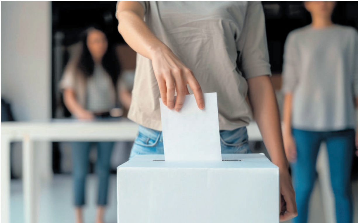
En las universidades, los jóvenes también participan del ejercicio democrático y tienen la opción de ejercer su derecho al voto, eligiendo a sus representantes ante el Consejo Superior.

La mejor manera de protegerse contra los extremismos ideológicos y las reducciones dogmáticas es formar ciudadanos que sean capaces de entender su realidad, dialogar con la diferencia