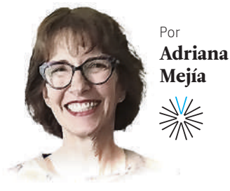
Por Adriana Mejía