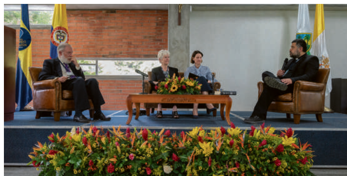
Como parte del aniversario de los 30 años, el Colegio reunió durante tres días a figuras internacionales del pensamiento pedagógico.