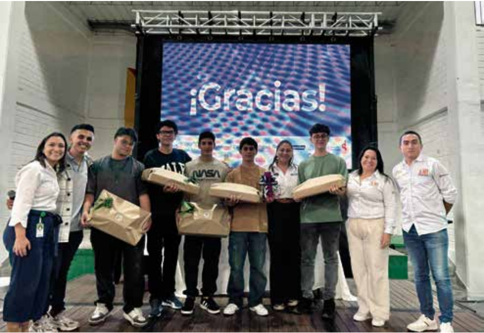
El equipo Perseus, del municipio de El Carmen de Viboral, se alzó con el primer lugar del Reto Devimed gracias a un robot capaz de inspeccionar y limpiar tuberías internas de las vías.