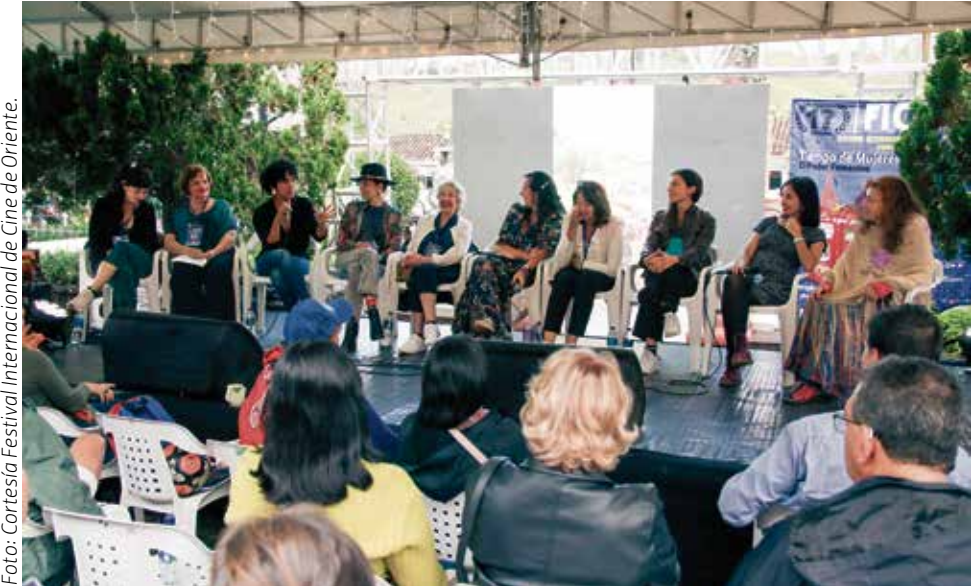
En esta edición, el festival reunirá un importante grupo de directoras, directores, guionistas, críticos, actrices y actores de la industria cinematográfica y audiovisual, al igual que académicos expertos en derechos humanos y memoria, para darle vida al festival y complementar su programación académica.