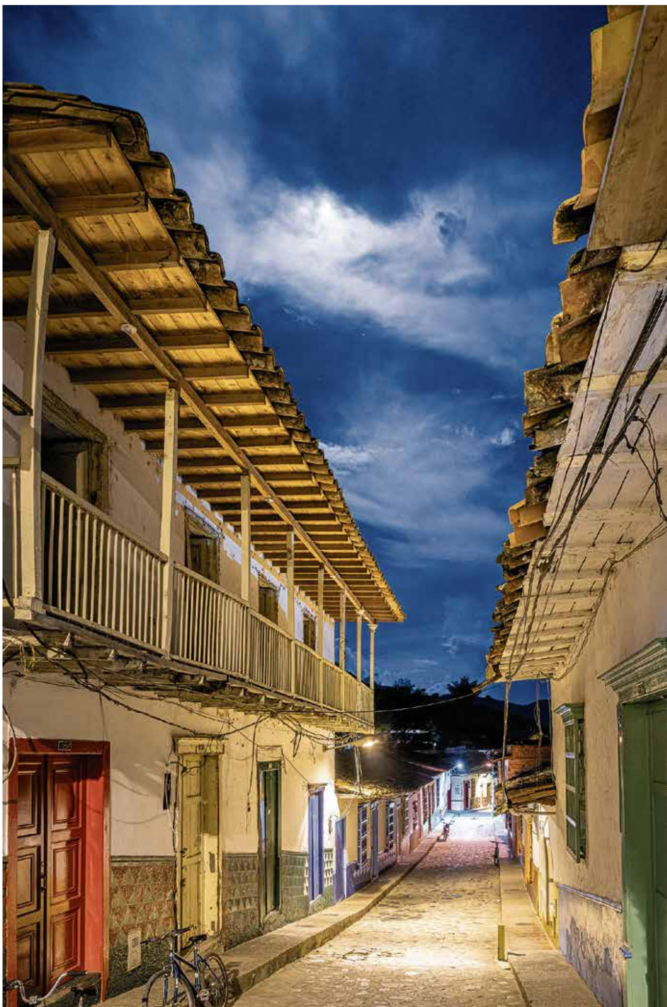
FOTO: Noche nublada de luna llena sobre la carrera Córdoba, en Concepción. / FECHA: 2021

ENCUENTRE HOY: SEPARATA VIVIR EN DEMOCRACIA