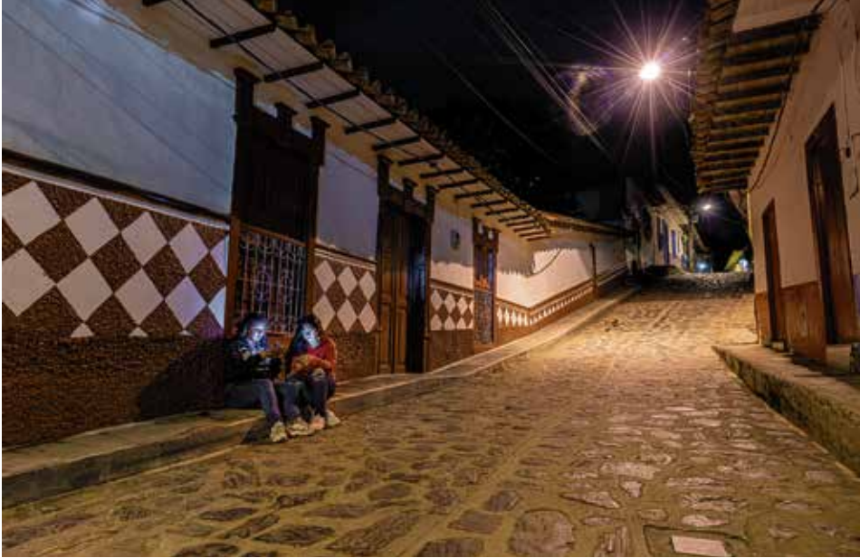
Durante cuatro días el público tendrá acceso a una programación académica y de industria, proyecciones, cine foros, paneles, conferencias, con eventos especiales en el parque principal de Concepción, su Casa de la Cultura, auditorios y en algunos establecimientos tipo cafés gourmet.

tiene un turismo sostenible donde la gente puede ir y sentarse en un parque tranquilamente a ver una película”, recalcó Morales. El germen del festival De 2007 a 2016, el festival tuvo sus inicios en Rionegro, en un ámbito que durante varios años gozó de buen cine y películas de toda índole; después, de 2012 a 2023, estuvo en Guatapé, lo que hizo que el festival compartiera unos años su contenido en estos dos municipios. Y, desde el año pasado, Concepción ha sido la casa de este certamen cultural. Este festival, a través de su programación, buscará que las víctimas compartan sus historias, experiencias y perspectivas, dándoles voz y visibilizando sus experiencias. “El cine, al presentar historias humanas y emotivas”, resalta Morales. Y agrega: “Puede generar empatía en el público, creando conciencia sobre el impacto de la violencia y la importancia de la justicia”.