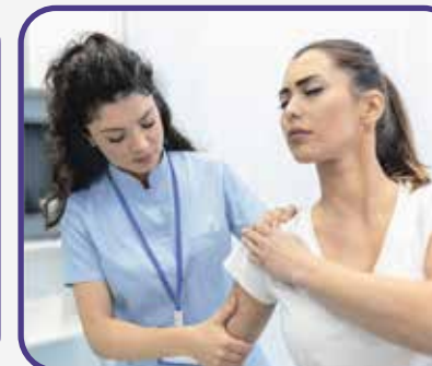
Medicina del dolor